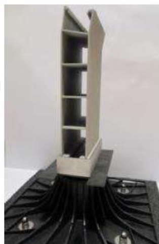
PRODLOUŽENÍ 45 + FIXAČNÍ RÁMEČEK